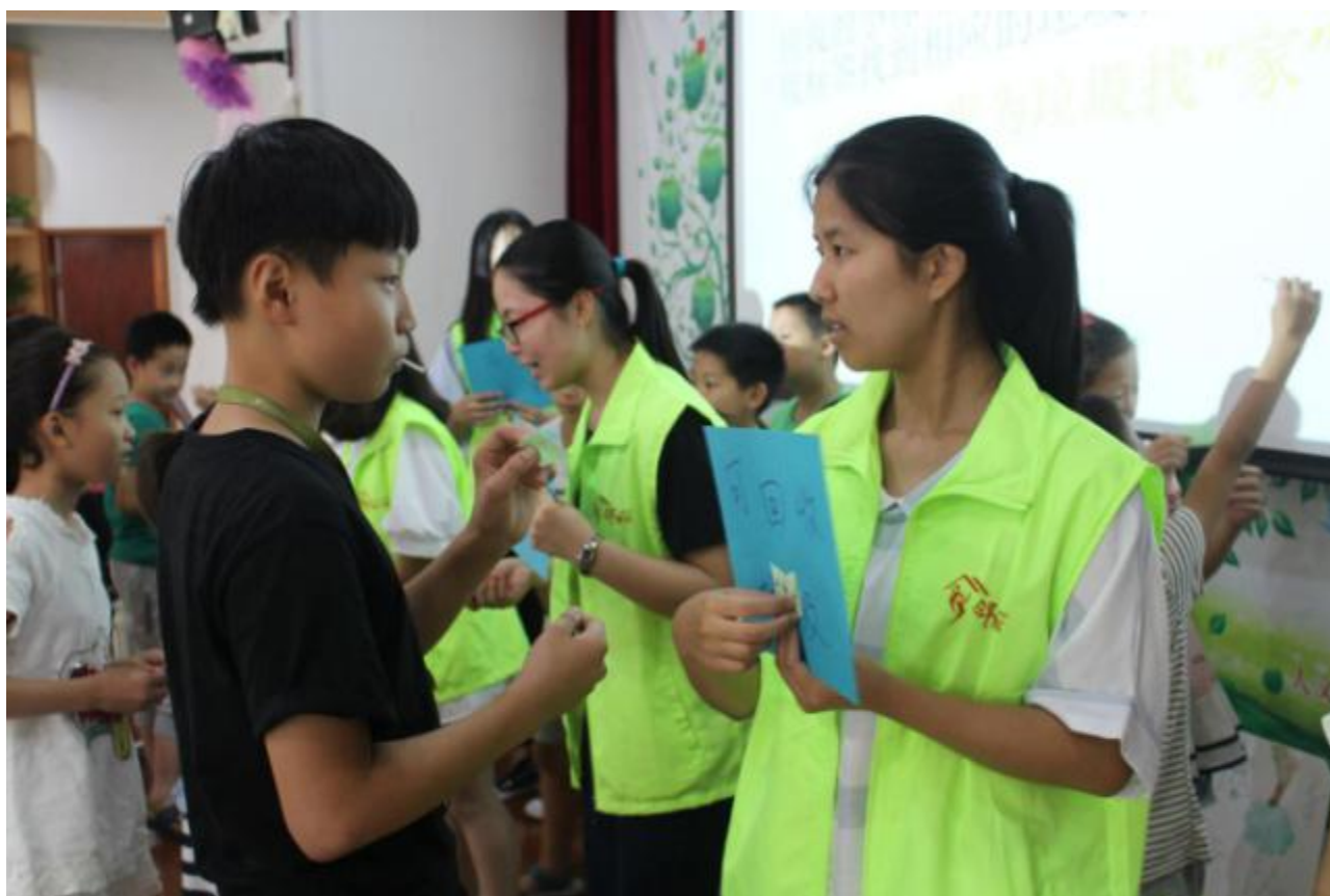
我院学生参加杭州经济技术开发区白杨街道邻里社区活动