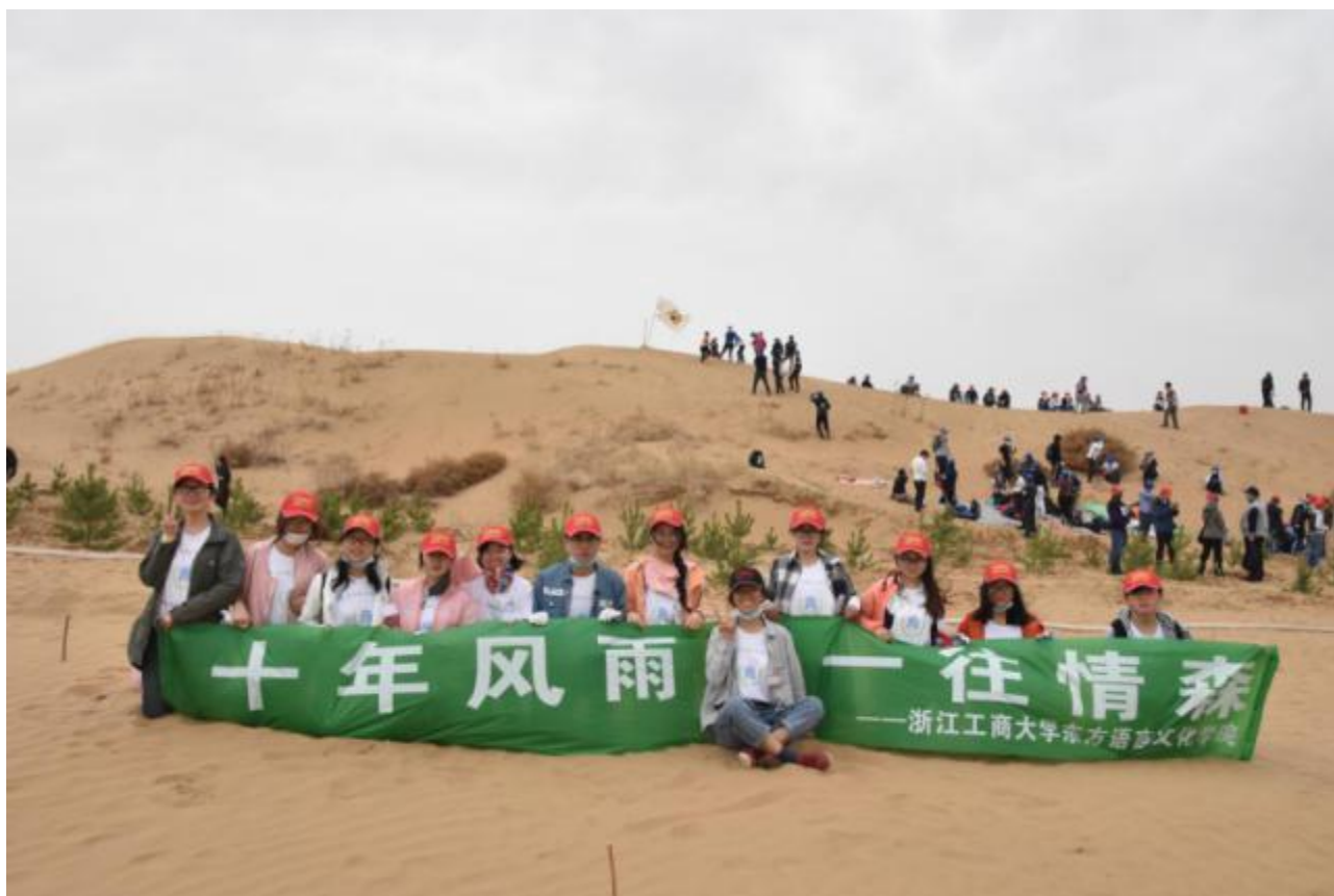
中日青年内蒙古沙漠植树交流活动