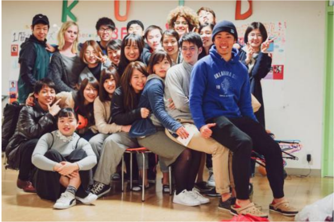
国际留学生寮的欢乐日常