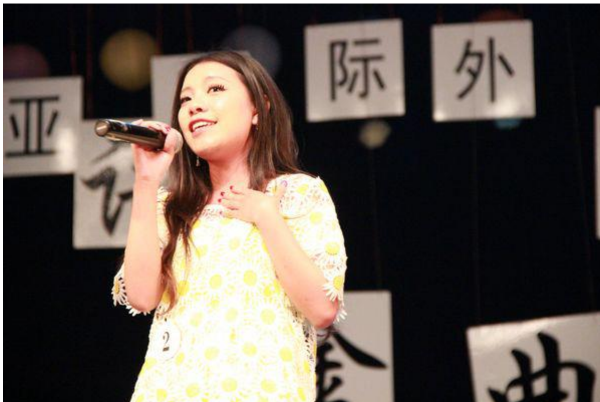
浙江省日语金曲大赛