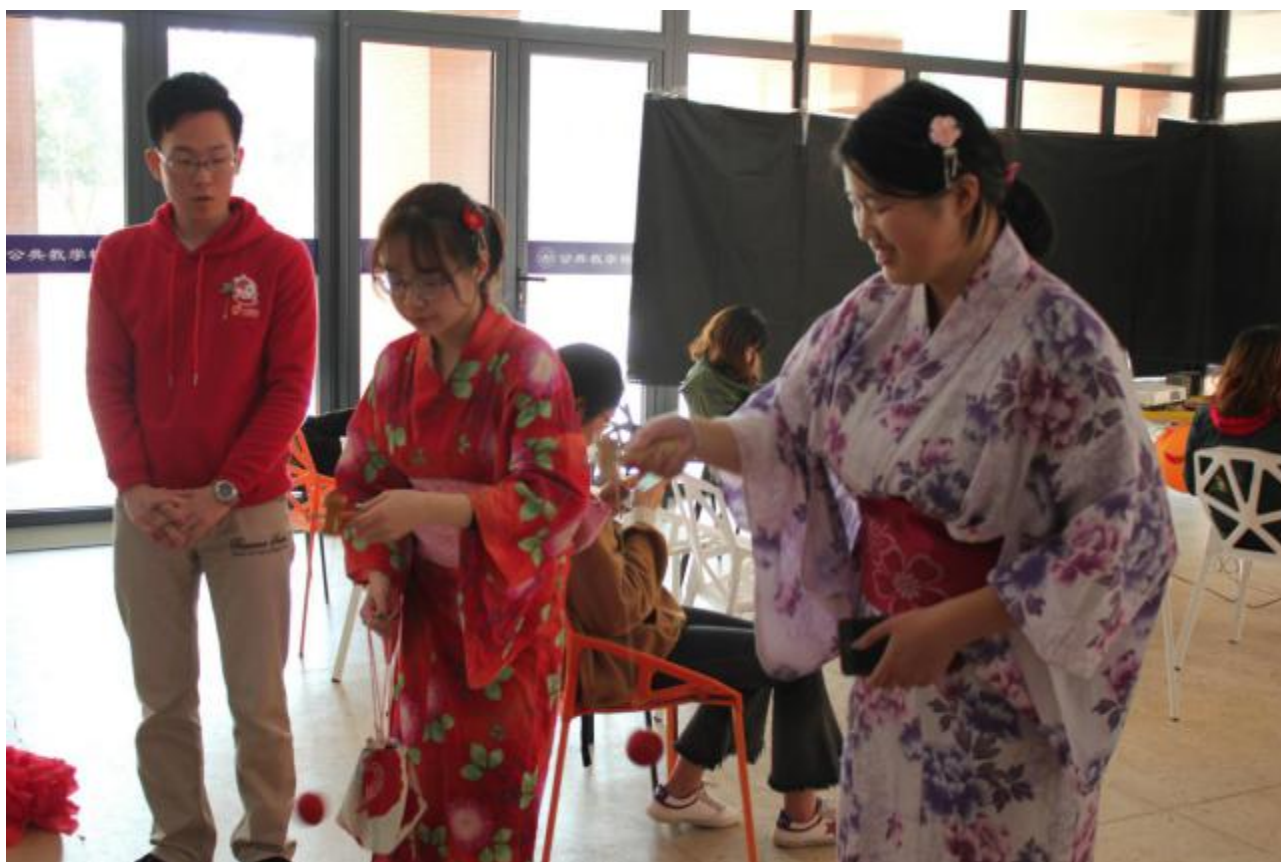
“雅俗日本”系列活动