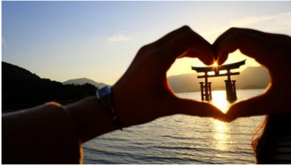
日本三景之严岛神社