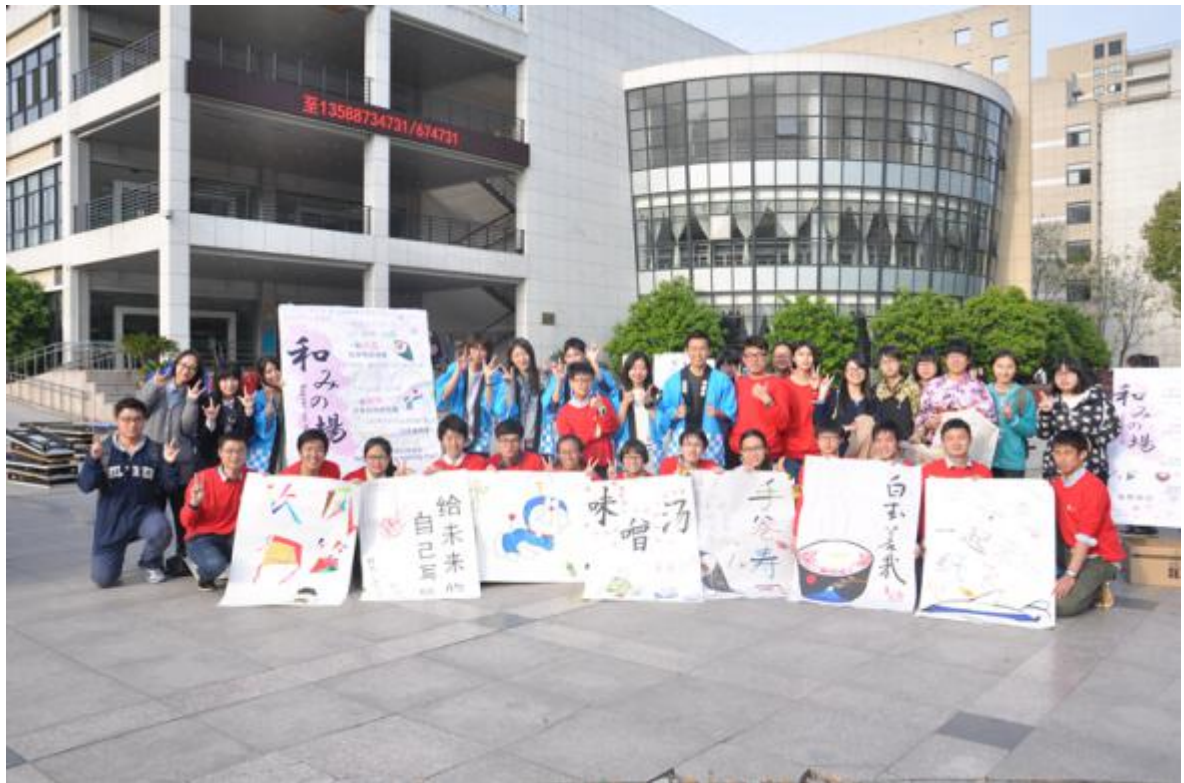
经常联合日本国际交流基金会、杭州“心连心”中日友好交流之窗等机构开展活动

志愿服务同样是我们生活的一个重要部分 小到社区服务、校园志愿者，大至 G20 峰会 无论是怎样的志愿活动 其中都有着我们的身影 大家虽然有些忙碌，脸上却依然充满笑容