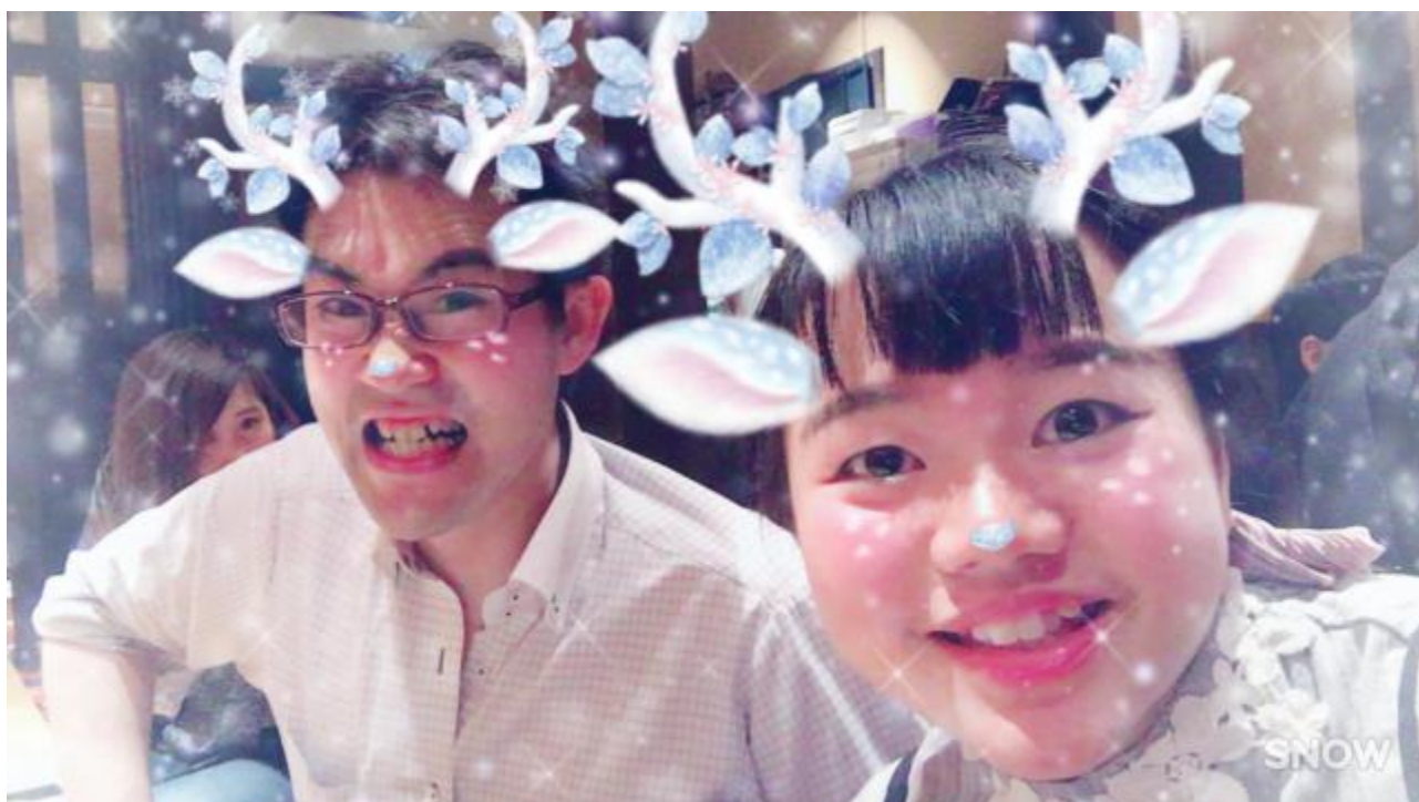
与兼职店店长的合影