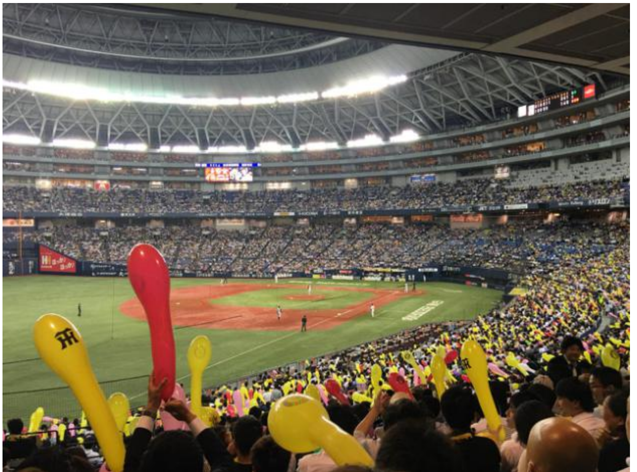
到了日本，当然要看一场棒球赛了