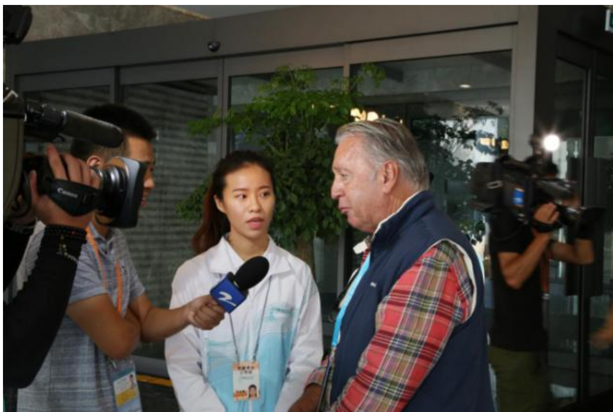
我院学子参与 2016 年 G20 杭州峰会志愿者活动