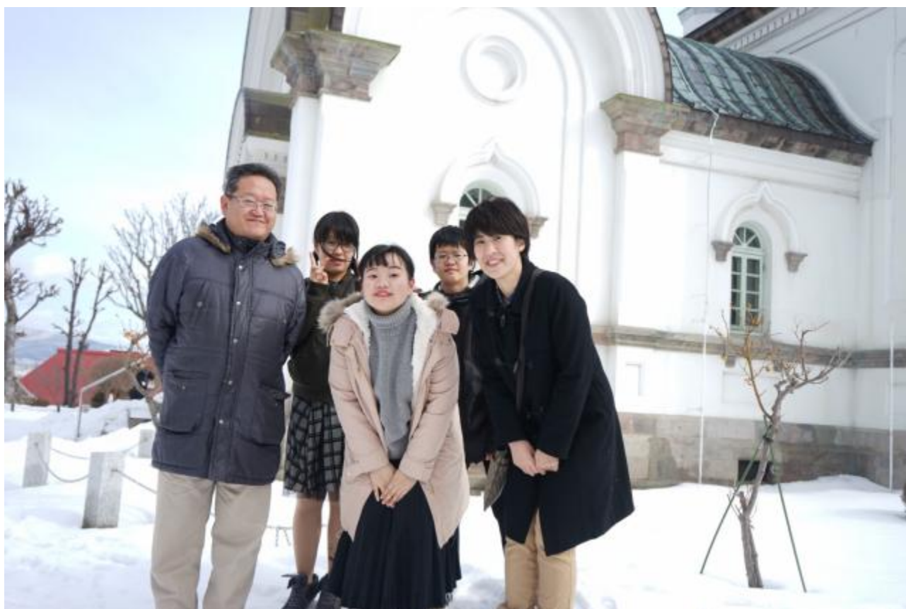
与 host family 在一起