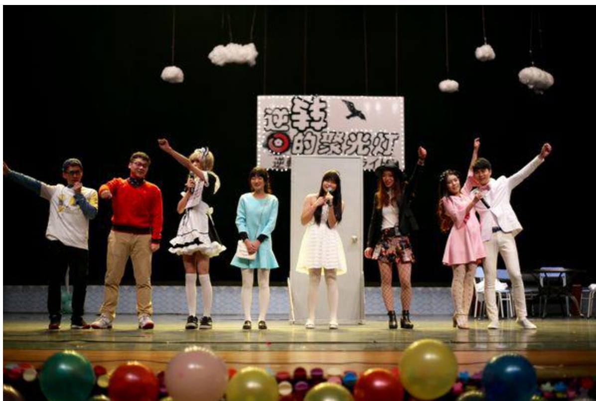
浙江省日剧 play 大赛