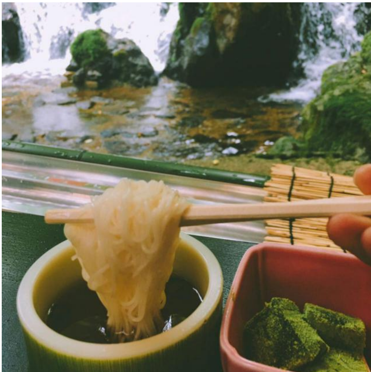
体验日本独特的流水素面